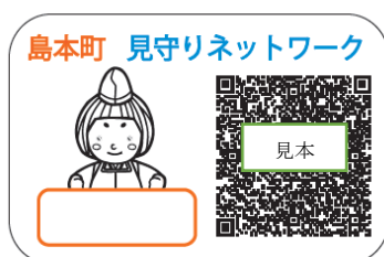
↑見守りQRコードシール例

行方不明になるおそれのある認知症高齢者等の、衣服や持ち物などに貼るシールです。ドライヤーやアイロンで簡単に貼り付けることができ、高齢者が行方不明になられた場合でも、その後保護された際にQRコードをスマートフォン、携帯電話で読み込むと、島本町ホームページのURLが表示され、それをクリックすると島本町ホームページ内の町の連絡先が記載されているページが表示されます。保護された後、スムーズな連絡と身元確認のため、ぜひご利用ください。