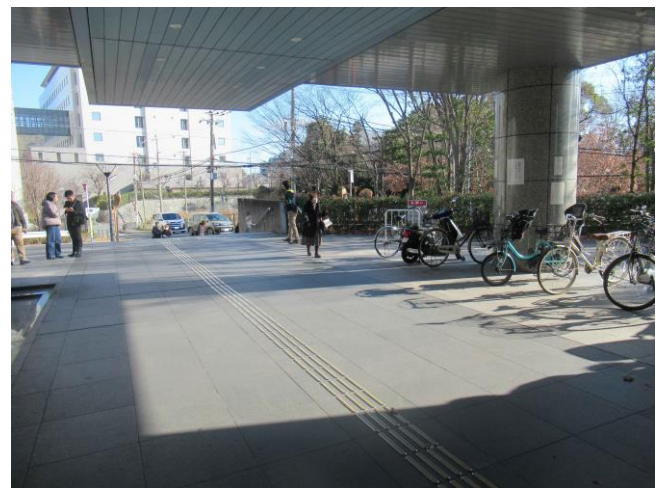
10. 警備 (地下駐車場付近)