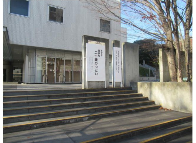
14. 看板 (地下入口)