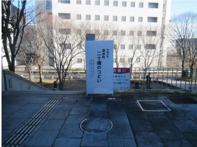
13. 看板 (プラットフォーム)