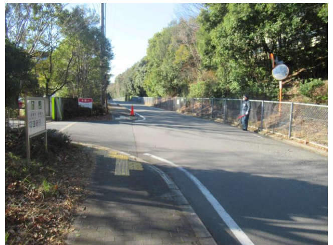
8. 警備 (1階正面入口)