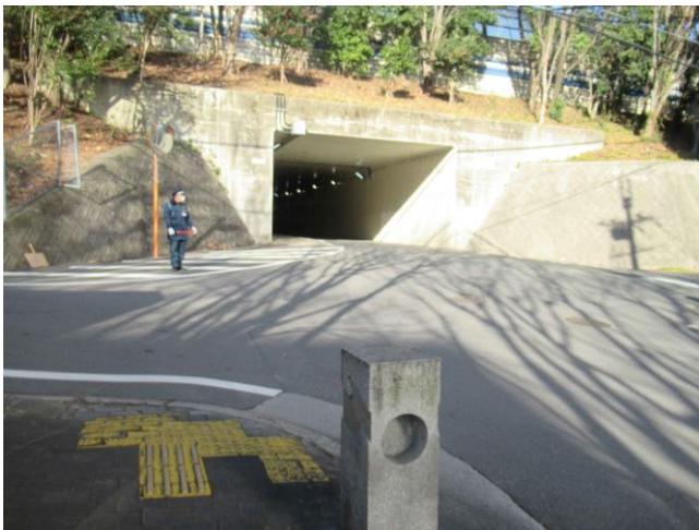
9. 警備 (トンネル付近)