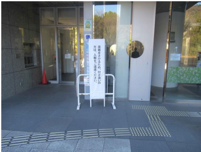
15. 看板 (1階入口前)