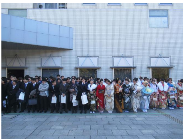
11. 集合写真 (1回目)