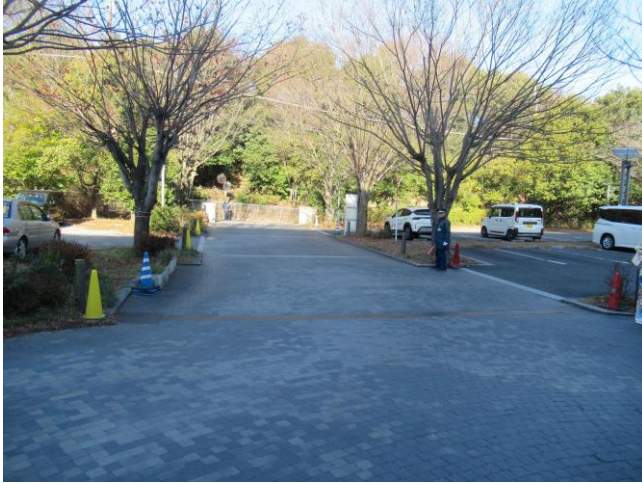
7. 警備 (1階駐車場)