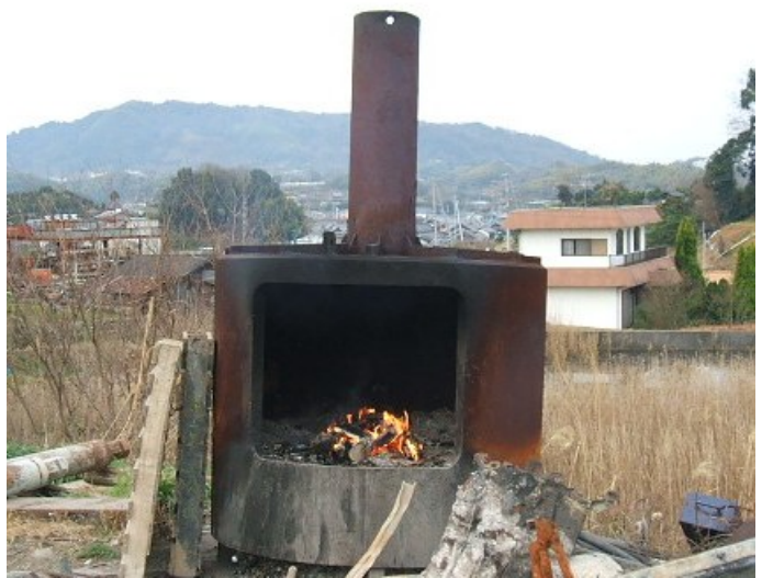
基準を満たさない焼却炉で焼却