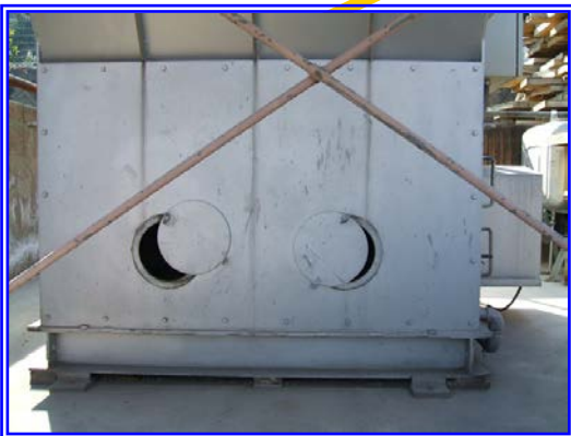
調節可能な空気取入れ口