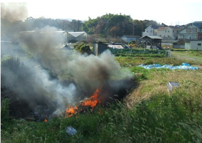
農業用ビニールシートなどを野焼き