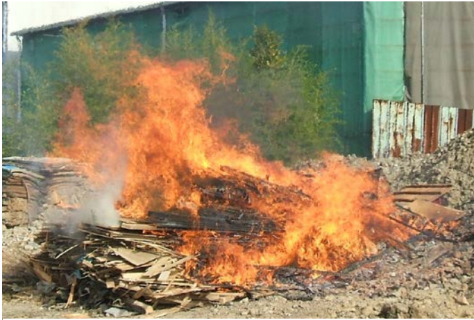
あからさまな野焼き