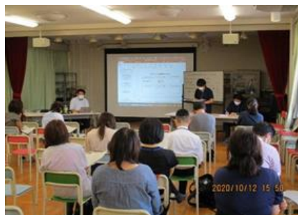
教職員対象研修会

各小中学校と、各保育所幼稚園の支援教育を推進する担当者が連携し、支援教育の研究や交流を進めています。町内の支援を必要とする子どもたちが、保幼小中で一貫した、よりよい支援教育を受けられることを目標とし、子どもの発達に関する研修や支援教育における授業研究、情報の交流、就学前から中学校卒業後まで、福祉との効果的な連携を目指した研修などを行っています。また、各校園所では支援教育に関する相談窓口があり、随時相談することができます。