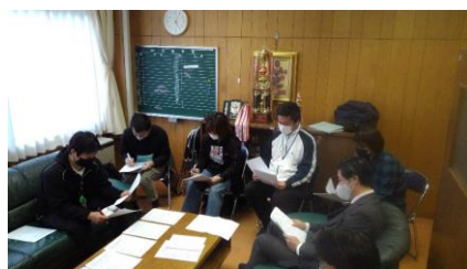
小中生活指導研究協議会

また、近年児童・生徒指導面で課題となっているテーマに対して、小中間での課題の共有と教員の意識向上に努めています。