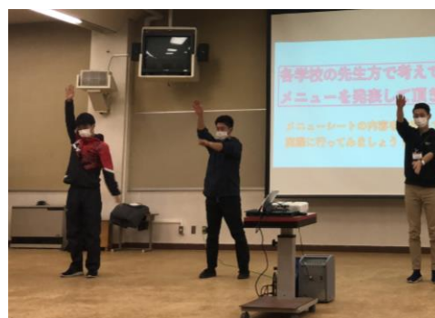
町教育研究会 教科部会