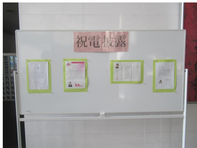
4. 祝電披露 青少年コーナー