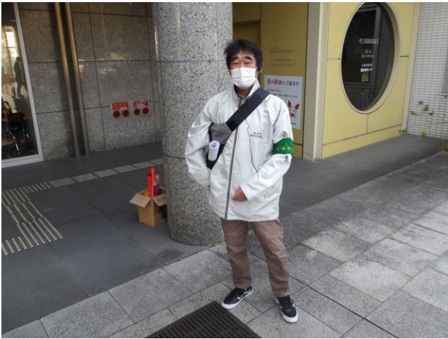
9. 警備 (正面入口)