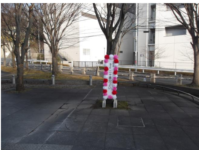
17. 看板 (プラットフォーム階段降りた場所)