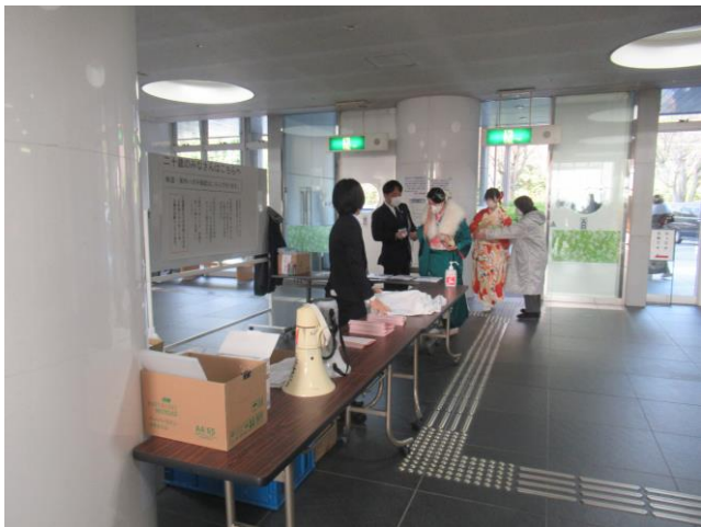
1. 受付の様子 (1階入口中)