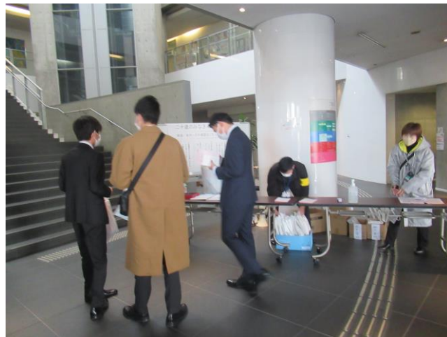
2. 受付の様子 (地階入口中)