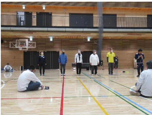
なわとび2人跳び(各市町代表者)