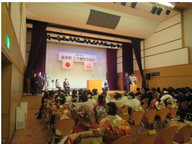
5. 会場内の様子 (1回目)