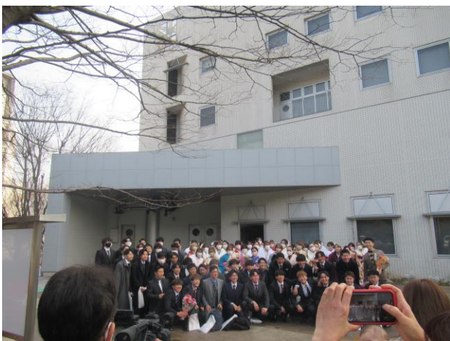
13. 集合写真 (1回目)