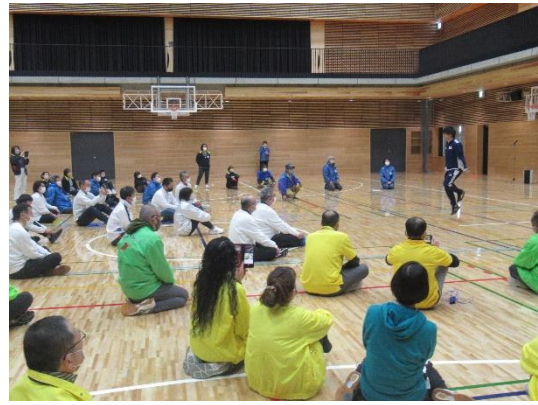
なわとびパフォーマンス