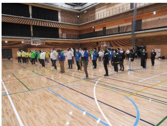
三島各市町の青少年指導員が集合・整列