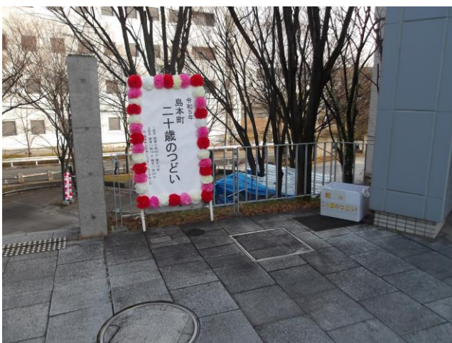
15. 看板 (プラットフォーム)