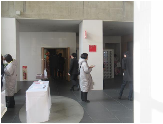
7. 会場外の様子 (式典前) ロビー