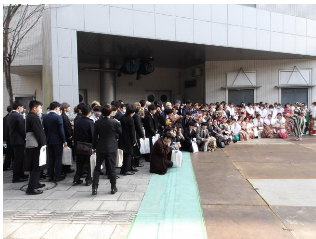
14. 集合写真 (2回目)