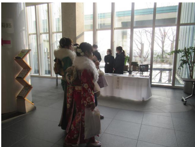
3. 会場外の様子 (式典開始前) 青少年コーナー