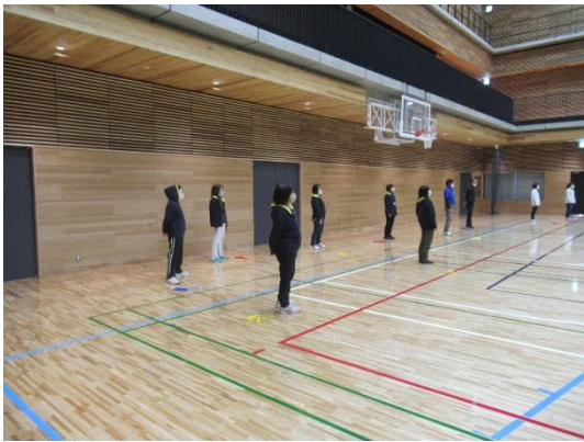
島本町青少年指導員