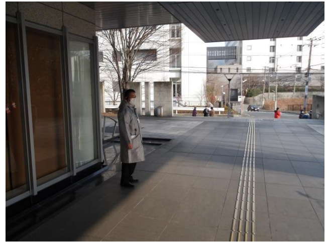
10. 警備 (地下入口)