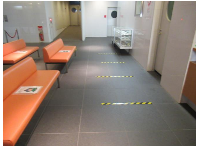
8. 会場外の様子 (間隔対応) 集団検診室前