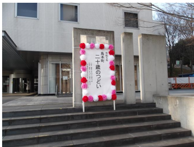
16. 看板 (地下入口)