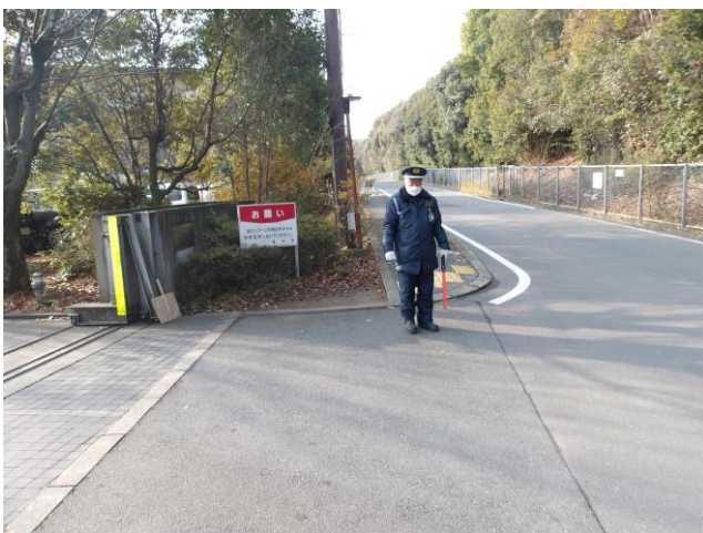
11. 看板 (正面入口出入口)