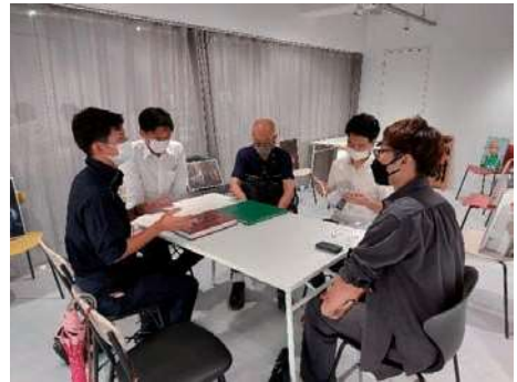
達人への取材の様子

島本の達人として20組の取材、編集、写真撮影を実施した。これまでに町内で活躍をされてきた方々だけでなく、世界的に評価された写真家や、メディアにも多数取り上げられているアイシングクッキー作家など、新たな人材を発掘することができた。