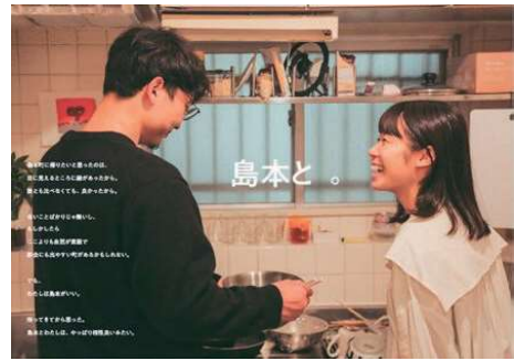
デザイン計画キービジュアル

11月にデザイン計画に関する役場全職員を対象とした基礎研修、実務職員を対象とした応用研修を開催。地域ブランドを形成した発信への取組を開始することができた。