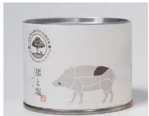
ジビエの缶詰デザイン案

大阪成蹊大学の協力のもと、7事業者の既存商品を、新たにお土産用商品としてデザインした。時間とコストを縮減するため、既存商品をお土産として売り出していけるようデザインをし、島本町の特産を活かしたジビエの缶詰や、筍のスコーンといったお土産商品を開発することができた。商品デザインに選ばれた学生は、町長から表彰を行った。