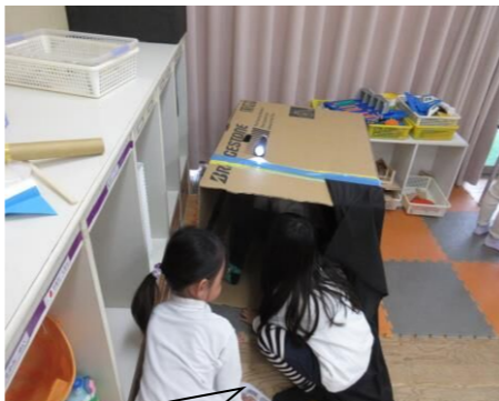
大きなダンボールの中で・・・