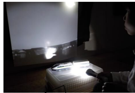
電車が動いているみたい