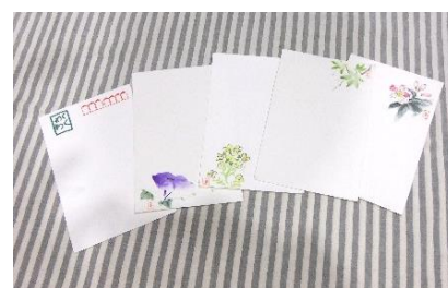
手すきハガキ 1枚 50円