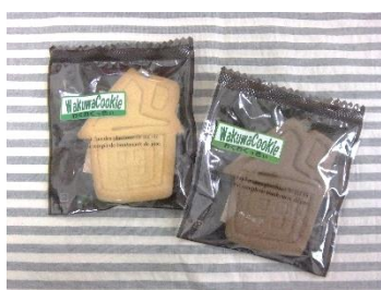
わくわくっくい 150円