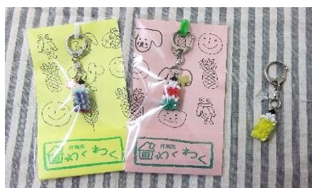
鉛筆キーホルダー 200円