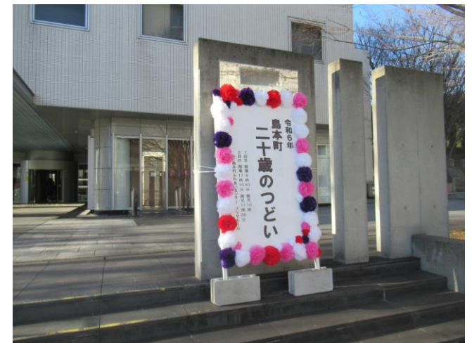
16. 看板 (地下入口)