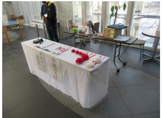
2. 受付の様子 (主催者・来賓・特別ゲスト)