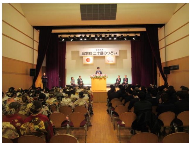
5. 会場内の様子 (1回目)