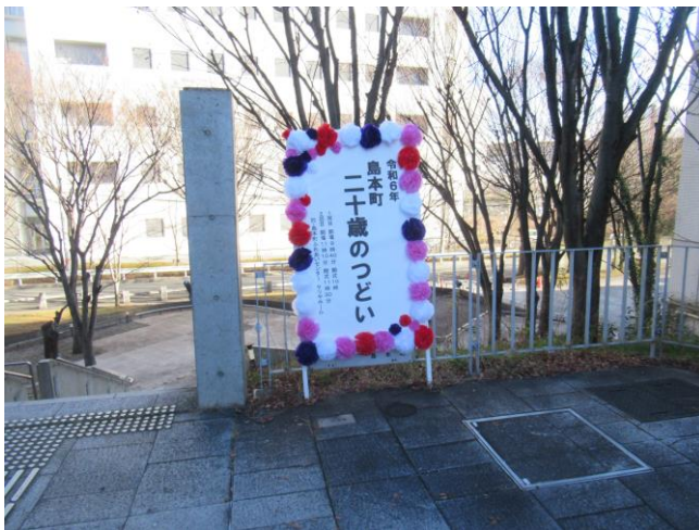
15. 看板 (プラットフォーム)