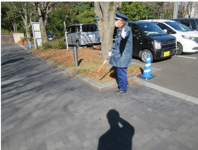
9. 警備 (正面入口)