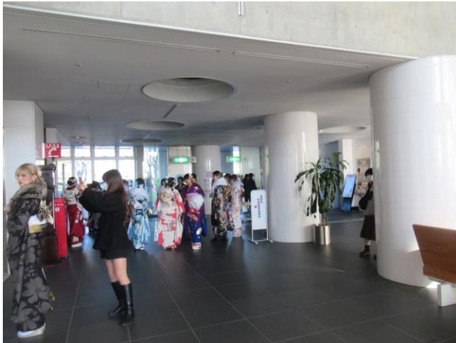
7. 会場外の様子 (式典前) ロビー