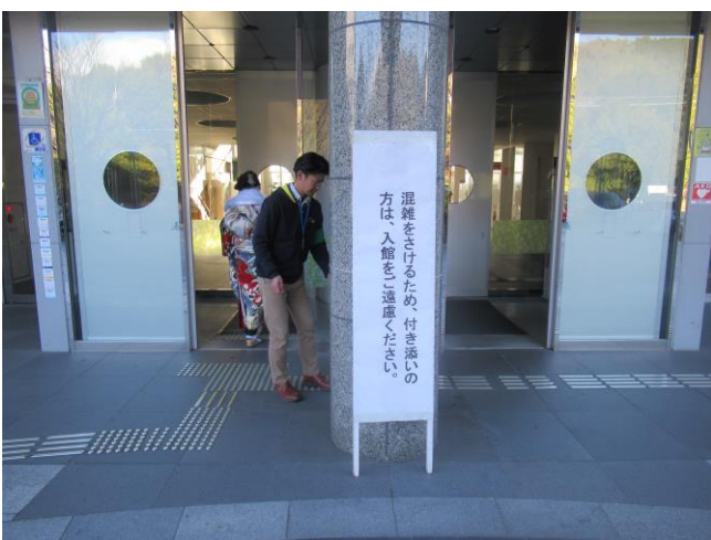
17. 看板 (1階入口前)