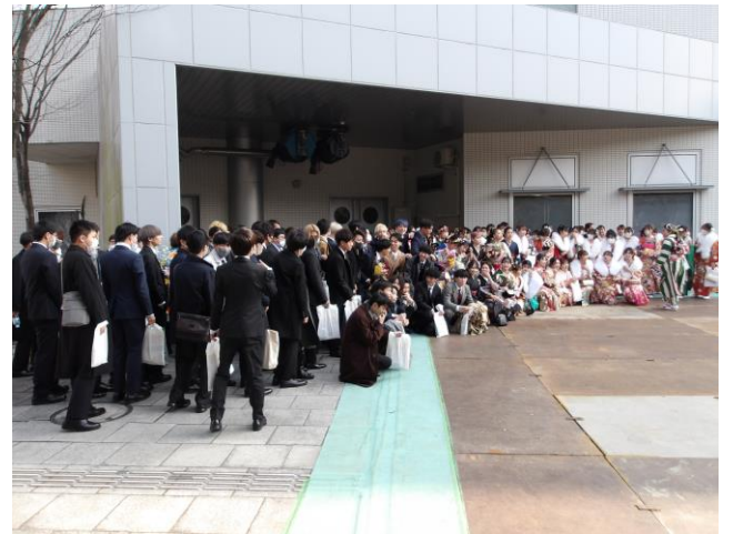
14. 集合写真 (2回目)