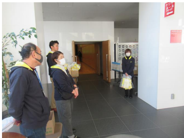
3. 受付の様子 (二十歳の成人)