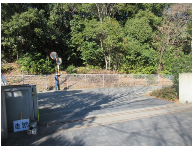
11. 警備 (正面入口出入口)