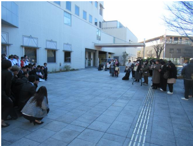
13. 集合写真 (1回目)