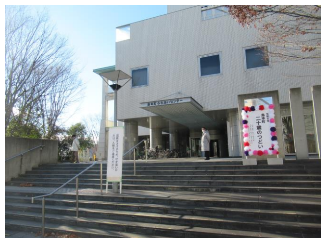
10. 警備 (地下入口)