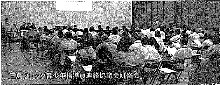
三島ブロック青少年指導員連絡協議会研修会