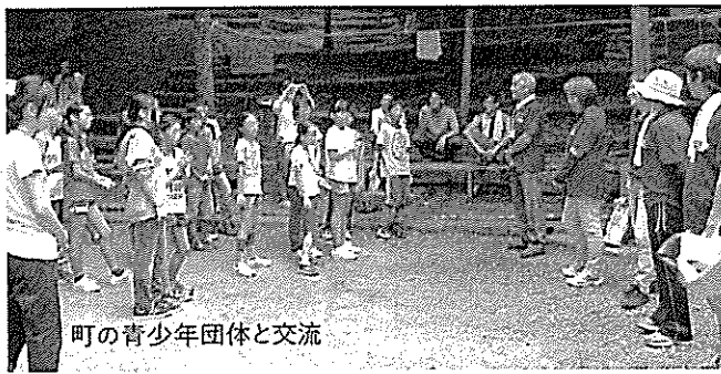
町の青少年団体と交流