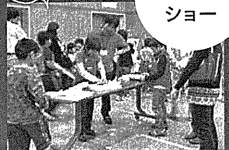
サイエンス ショー