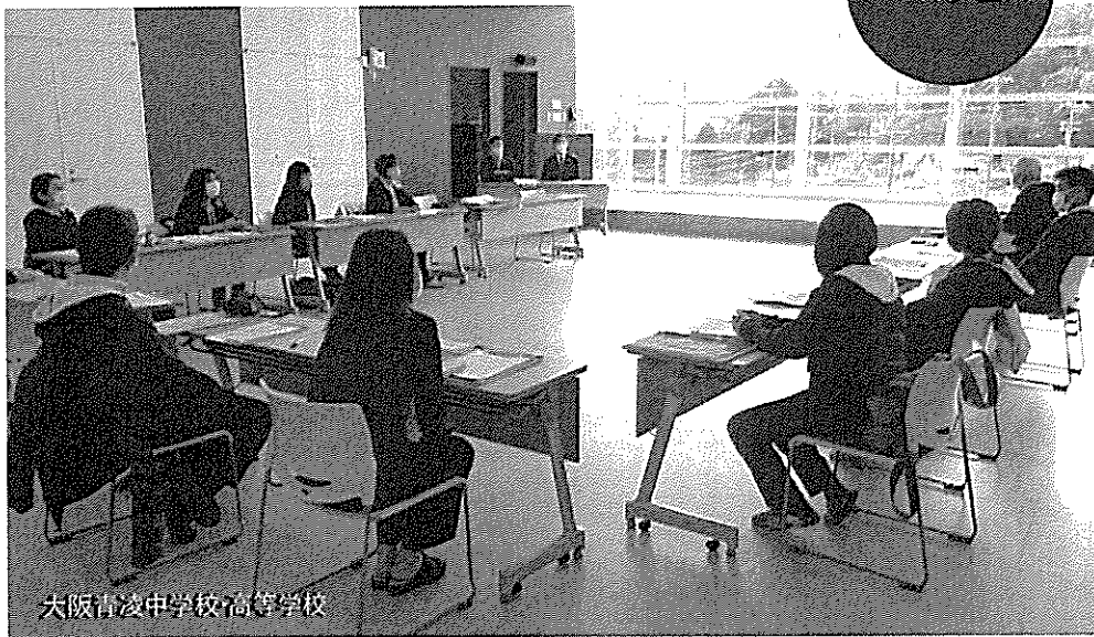
大阪清波中学校高等学校