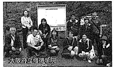
大阪府立修徳学院