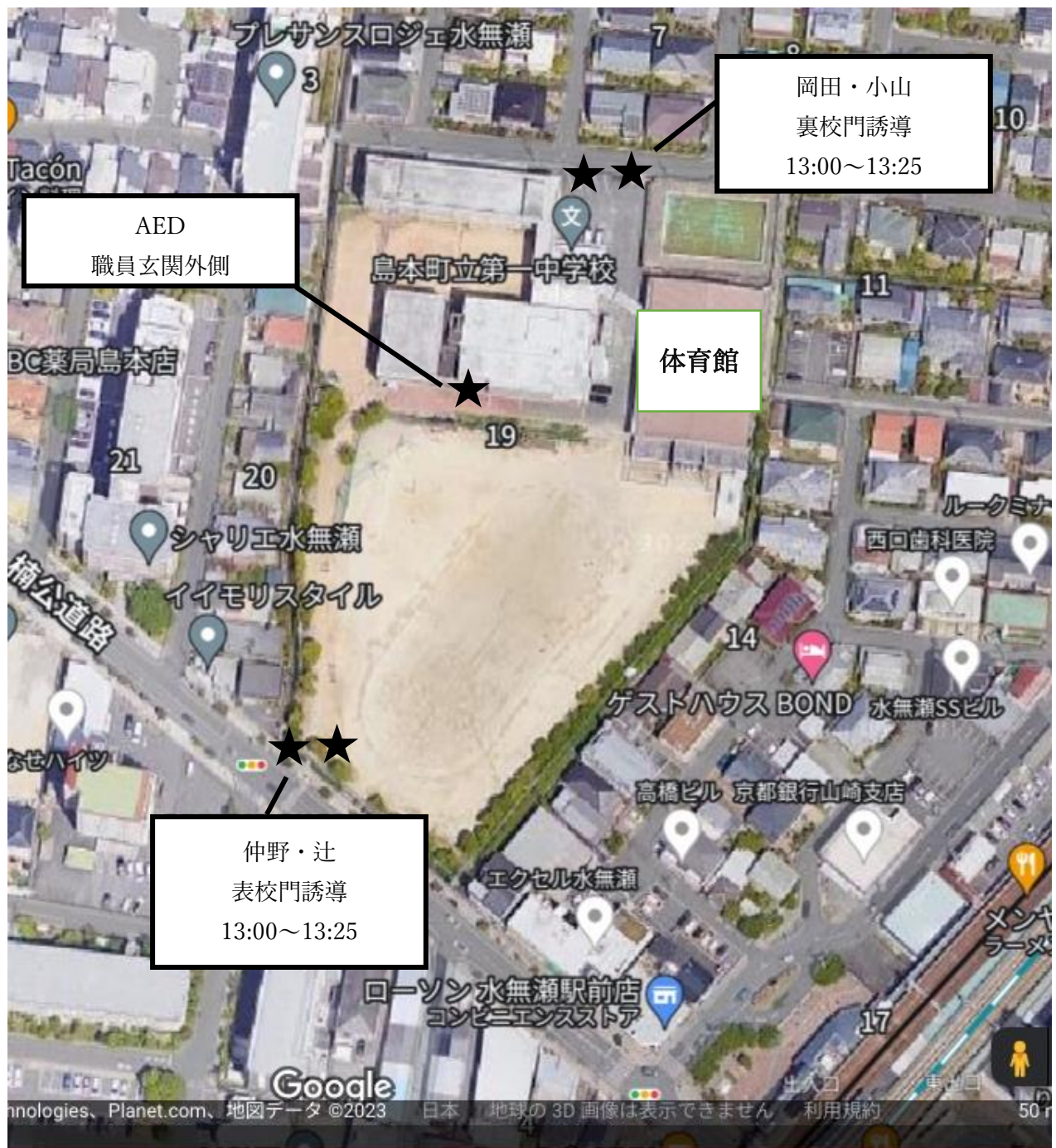
一中敷地内配置図